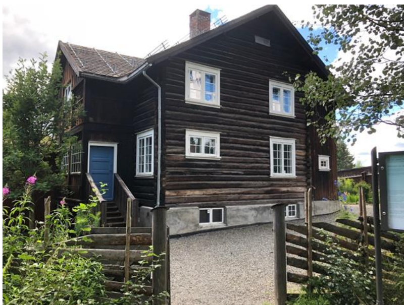
Til venstre det første huset hun leide, til høyre det som ble skrivestuen

Undset var opptatt av å skape rom for sin skrivekunst på Bjerkebæk. En eiendom hun utviklet etter de første årene bare å ha leid det ene huset. Hennes omfattende, og populære skrivekunst hadde satt henne i økonomisk stand til å kjøpe huset hun leide, og deretter nabohuset, som ble hennes skrivestue.