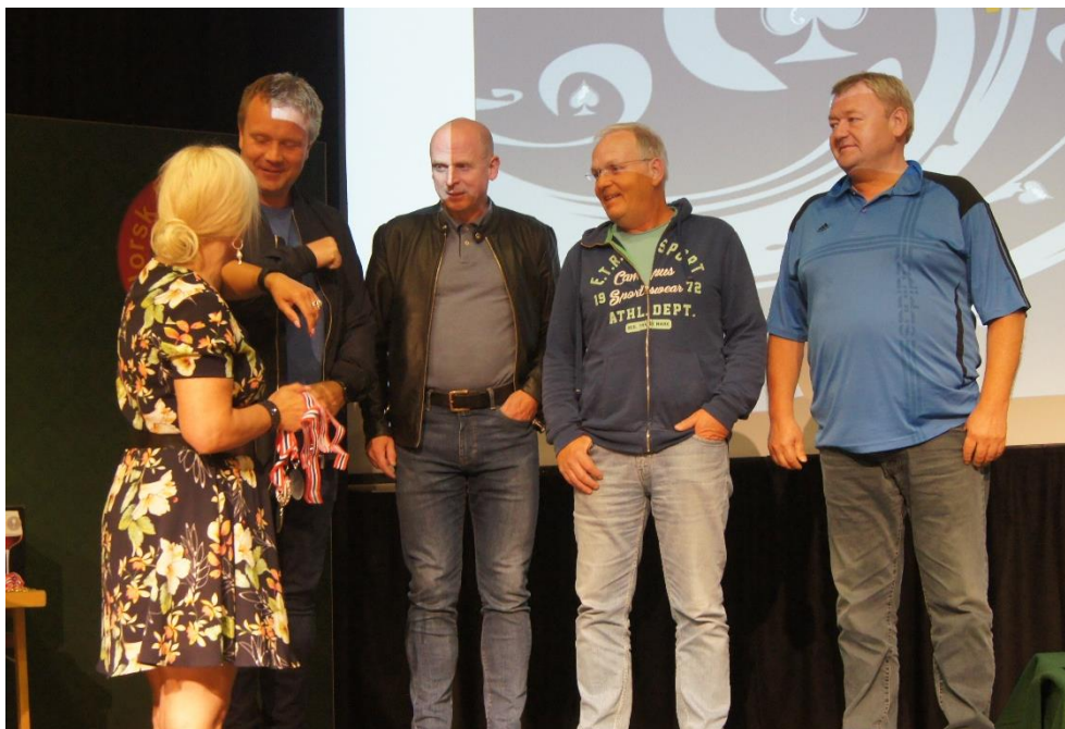
Artikkelforfatteren med lagkamerater på 2.plass på pallen etter NM Monrad lag.

De som fulgte oddsen og satset på dobbeltfinessen igjennom øst måtte notere beit. Startet du med trumf ess fulgt av liten til 9 kunne du notere hjemgang og suksess. Ble du spillefører i 6 NT var det derimot noe helt annet. Nå har du kløverfargen å «falle tilbake på» hvis hjerteren ikke ordner seg. Derfor vinner du utspillet med spar dame og spiller liten hjerter fra syd i annet stikk. følger vest lavt må du velge, la du nieren vant du din kontrakt.