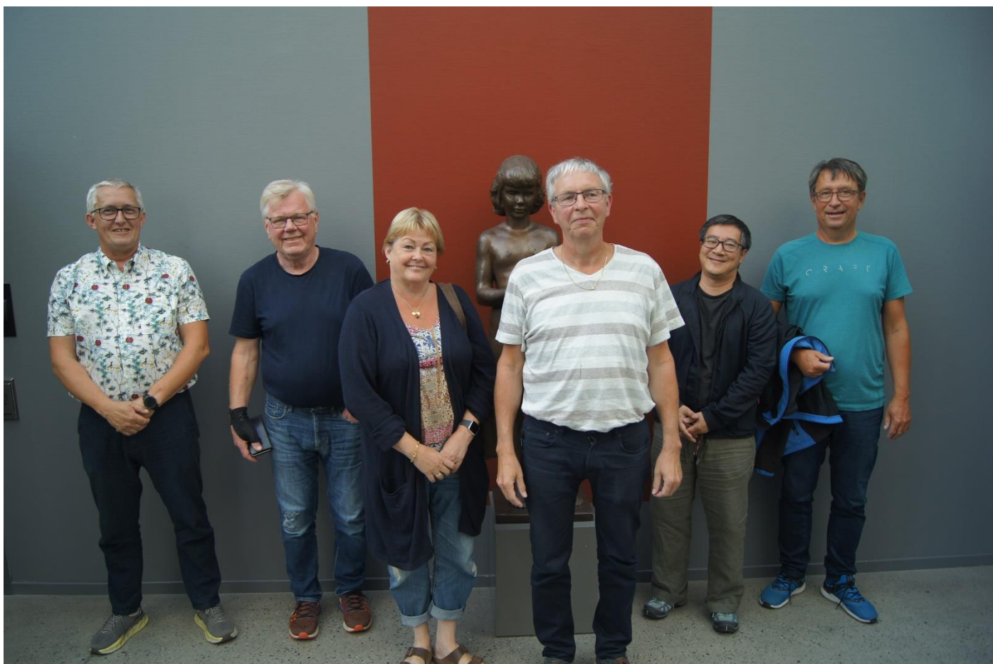
Her er pallen (med turneringsleder i bakgrunnen)