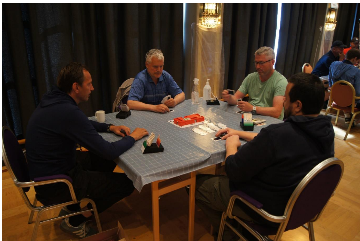
Fra Monrad par

West North East South 1♥ Pass 2♥ Pass 4♥ Pass Pass Pass