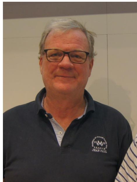
Han lot seg ikke be to ganger!

Det er mulig, selv om det ikke vites helt sikkert, at nord angrer på at han ikke bidro med en noe mer aktiv sperremelding i første melderunde!