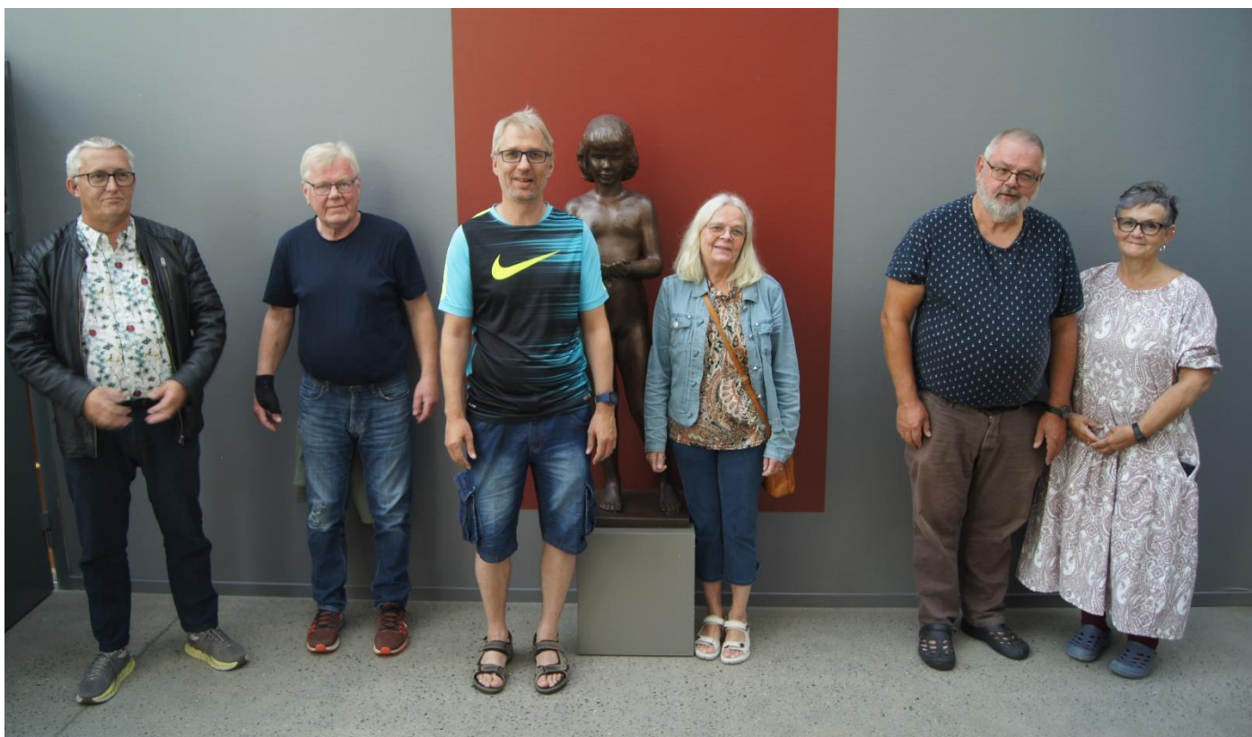
Og her er pallen (igjen med turneringsleder i midten,