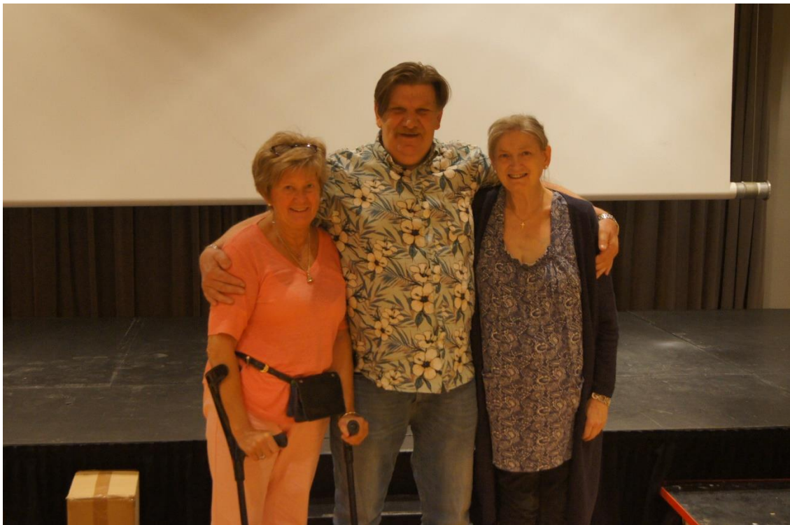
Sammenlagt-vinneren flankert av damene på delt 2.plass 😊