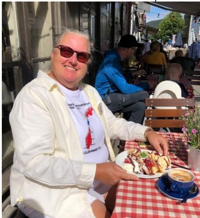
Her hadde jeg trengt hjelp av resten av redaksjonen – orket ikke alt.