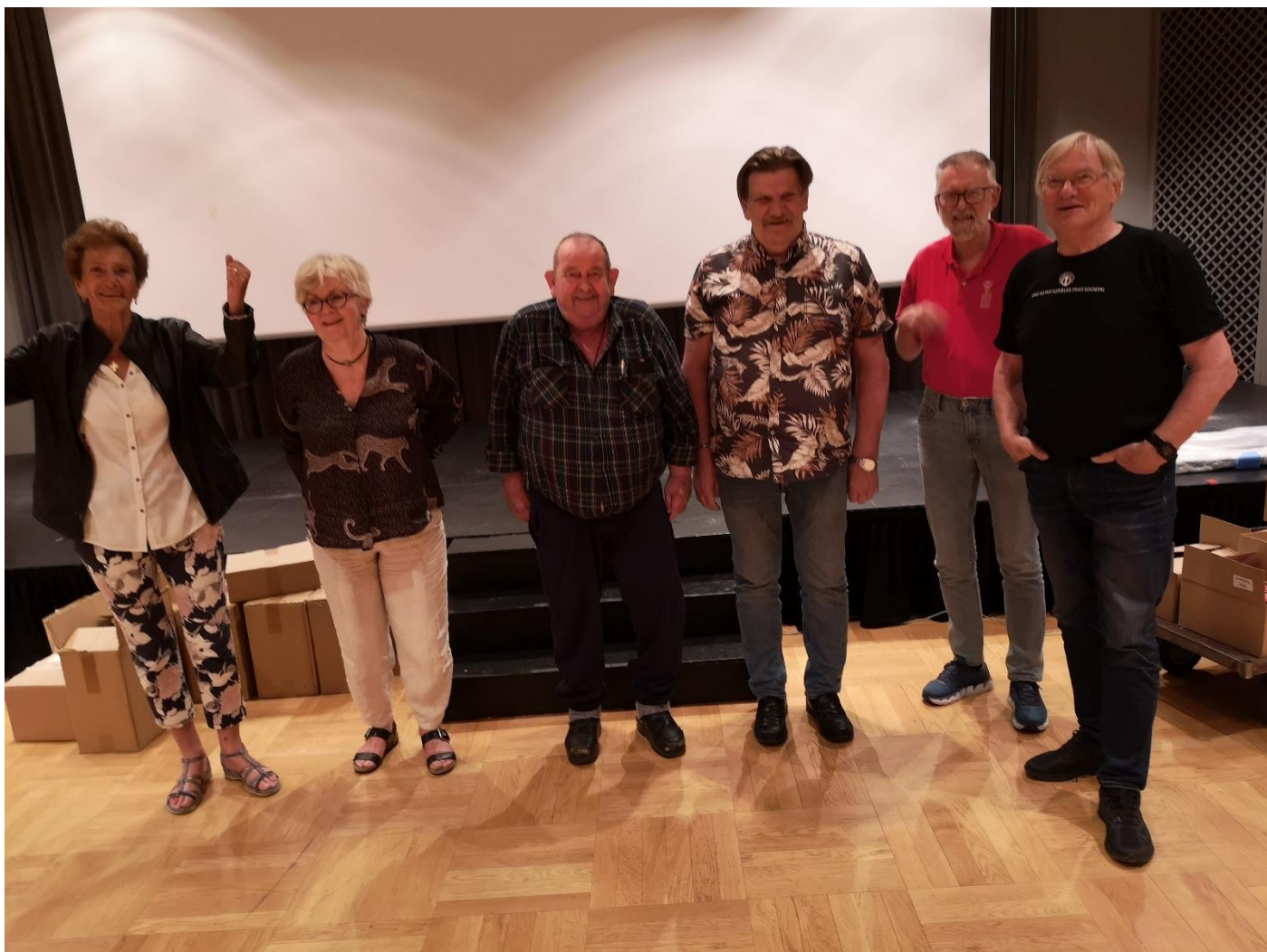
De tre beste parene 😊