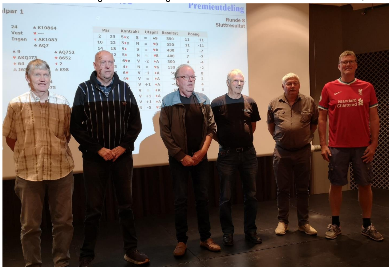
Pallen festivalpar 1