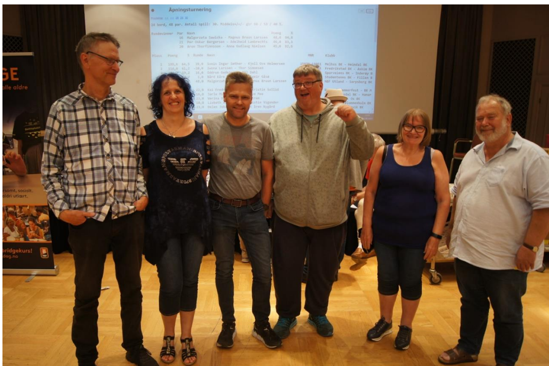
Pallen i åpningsturneringen