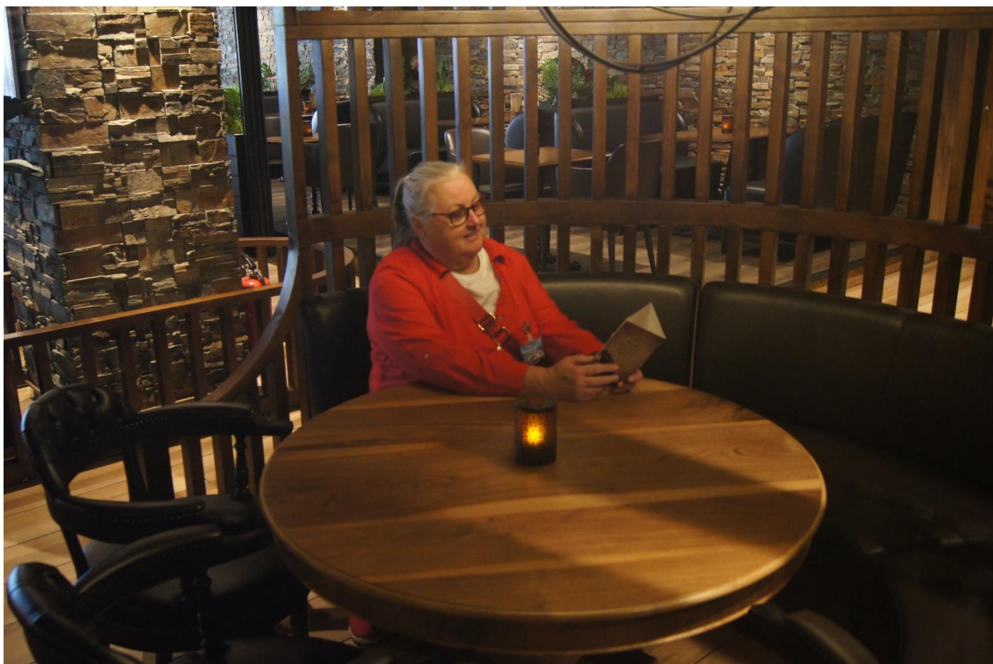
Interiørdetalj fra Khalles Corner

Og som om det ikke er nok med dette – så har Bridge for Alle delen av festivalen fått to flotte premier fra Khalles Corner. Som jeg etter dette kommer til å tenke på som K-Halles corner. Men det stedet skal vi presentere mer i neste bulletin.