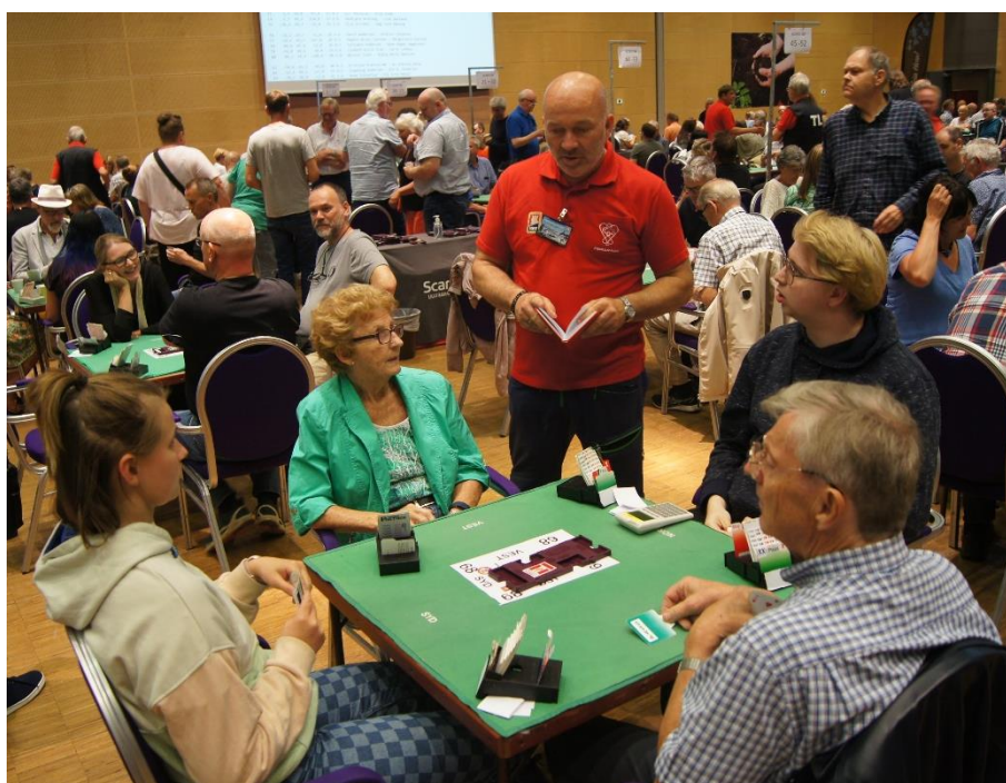
Pass utenfor tur, turneringsleder forklarer

Uten spar konge hadde øst uten videre returnert spar, siden han ikke gjorde det så er det fordi han har kongen. Så vi lasjerer knekten, og Øst blokkerer resten av fargen med sin konge. Alt forsvaret får er to sparstikk, og ett i hver minorfarge 😊