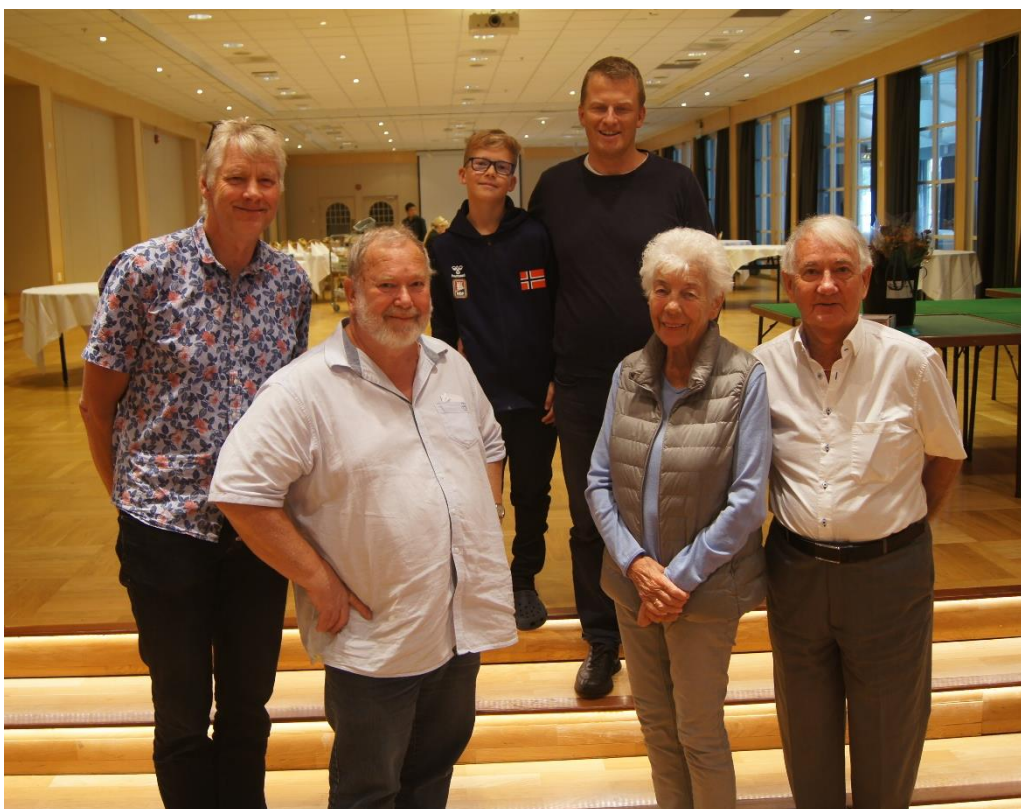
Pallen: Paus/Dahl, Moe/Moe og Hagen/Hagen