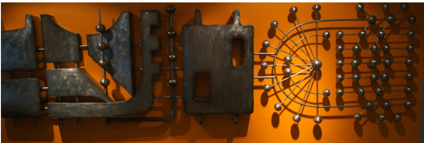
Utsmykningsdetalj fra vinmonopolet i Lillehammer i metall på murvegg

Antar at de kommer til å gjøre seg mer bemerket utover i festivalen 😊