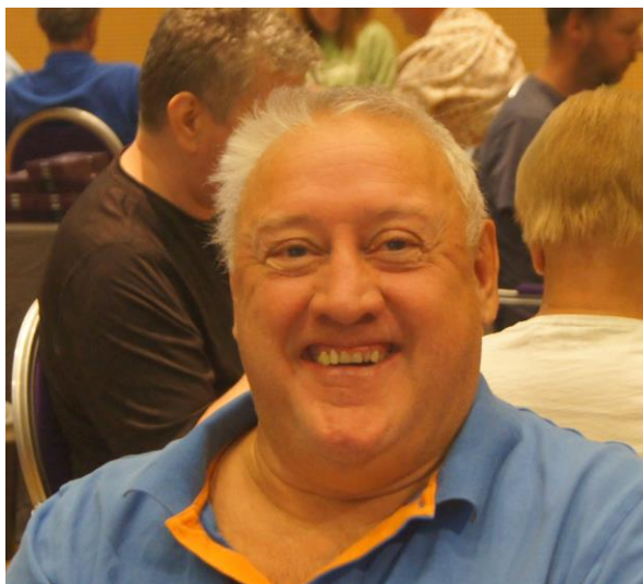
En blid, nykåret stormester, Jarle Bogen