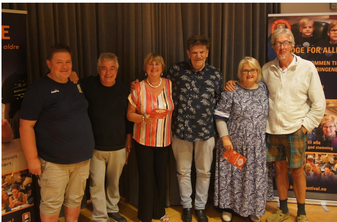
Her er de glade spillerne på pallen 😊