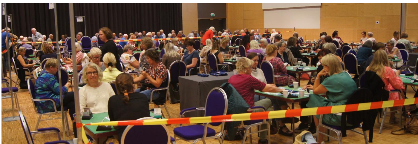
I dag er damene sperret inne 😊